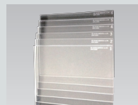
アクリルファントム