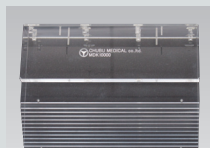
一体型ファントム